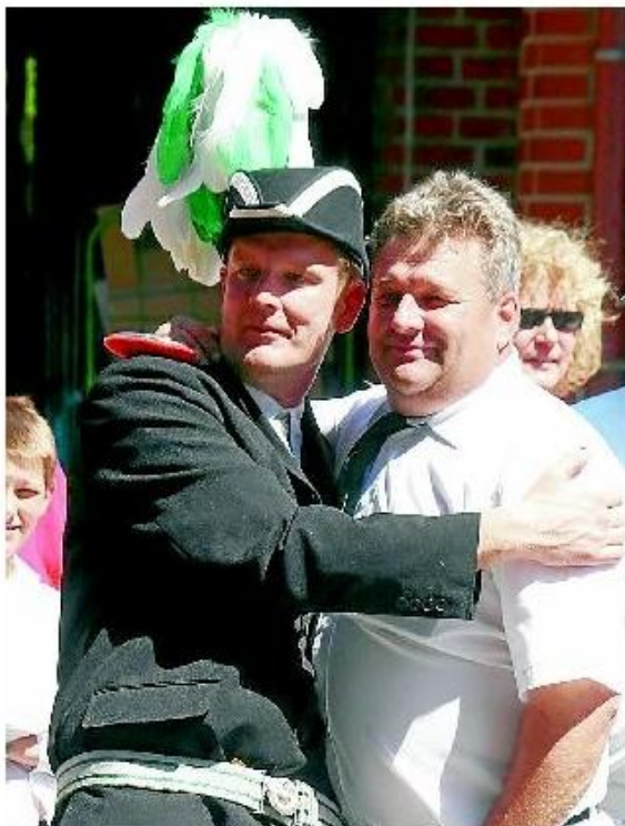
Die Schützenbrüder warten gespannt darauf, wem sie in diesem Jahr zuzubeln dürfen.

Der Sonntag, 26. Juni, steht ganz im Zeichen des Kaiserschießens, das nur alle fünf Jahre erfolgt. Um 12 Uhr treten die Schützen an und marschieren zum Festzelt. Dort geht es im Wett-schießen um den Kaisertitel. Die Proklamation des Mo-narchen wird um 15 Uhr er-wartet, che um 15.30 Uhr der Kaiserball beginnt.