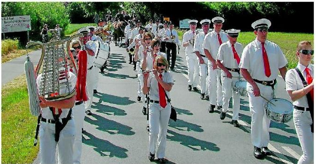
Mit Musik marschiert es sich gleich noch einmal so gut. Freitagabend ziehen die Schützen mit einem großen Festumzug durch Roxel.

Bereits um 9 Uhr morgens treffen sich die feiererprob-